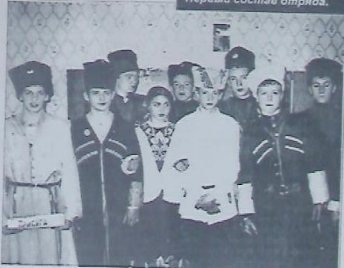
Первый состав отряда.

На классных часах ребята с интересом знакомятся с историей станицы, с земляками - героями Великой Отечественной. Узнают и православные традиции, а три человека посещают воскресную школу. На традиционном школьном празднике «Будем знакомы» 5 «А» разыграл сценку выборов губельного атамана, девочки пели, мальчишки танцевали.