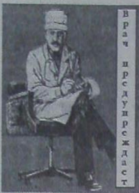
Врач и р е с д у и р с ж д а с т

Если же температура не идет на убыль, признаки болезни не исчезают, а наоборот появились кашель, боли в груди, затруднения в дыхании - есть основания заподоз-