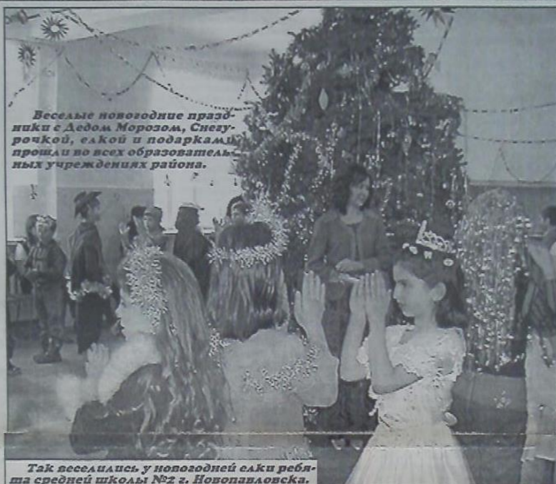
Веселые новогодние праздники с Дедом Морозом, Снегурочкой, елкой и подарками прошли во всех образовательных учреждениях района.