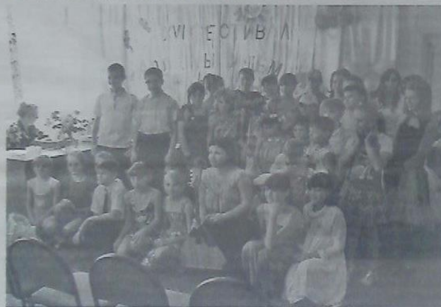
●Дети с ограниченными возможностями - участники 17-го фестиваля «Алло, мы ищем таланты!»

ные компенсации на оплату жилищно-коммунальных услуг. Для 90 детей составлены индивидуальные программы реабилитации. Инвалиды и часто болеющие дети направляются в краевой социально-реабилитационный центр для детей и подростков с ограниченными возможностями «Орлёнок». В течение года там подлечились 29 человек. Каждый год мы проводим фестиваль художественного творчества для детей с ограниченными возможностями и детей из социально не защищённых семей; в прошлом году такой фестиваль стал 17-м по счёту. Каждый участник получает благодарственное письмо и подарок. Устраиваются ново-