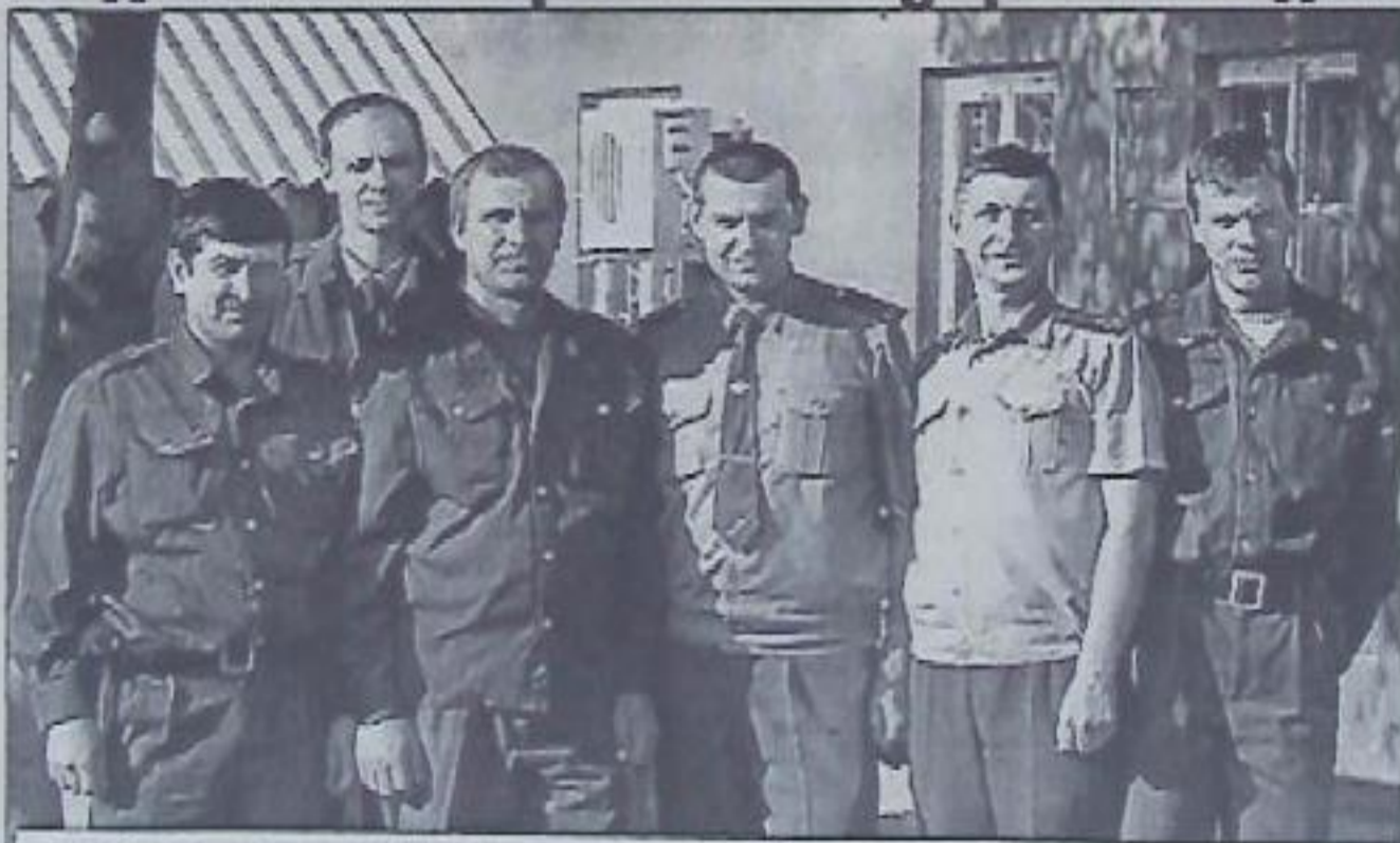
На снимке: коллектив отделения дознания Кировского ОВД.

С одной стороны, работа дознавателя по разрешению заявлений и сообщений о преступлениях и расследованию уголовных дел - ответственное дело, требующее соответствующей теоретической и практической подготовки, личной дисциплинированности, корректности, сдержанности, принципиальности, постоянного повышения профессионального уровня. С другой - работа в данном подразделении считается одной из самых трудных в РОВД и не престижных. Достаточно сказать, что за последние пять лет сменились 5 руководителей подразделения, ежегодно меняется и коллектив. Так, из работающих в настоящее время дознавателей, двое