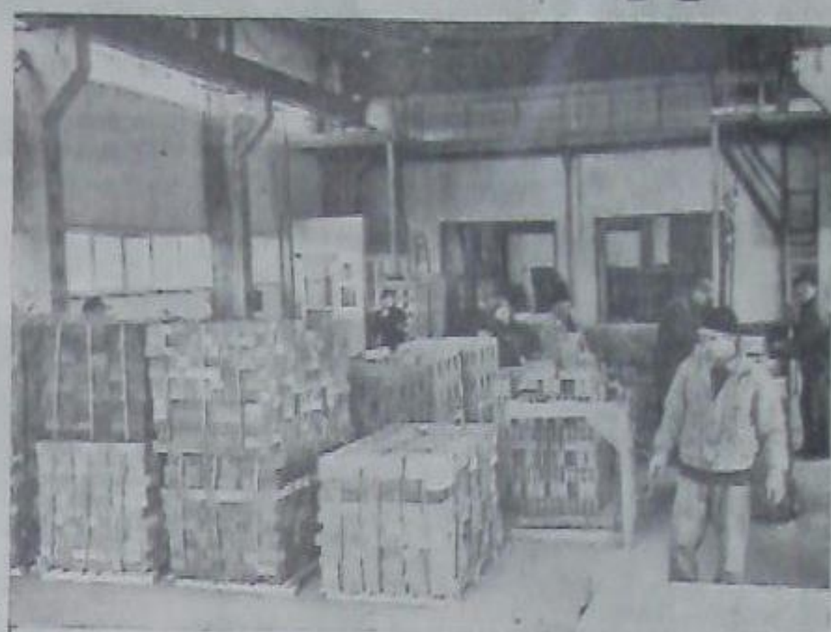
◆ Кинит работа в упаковочном цехе.

Сегодня в цехе трудится около 80 человек. При выходе завода