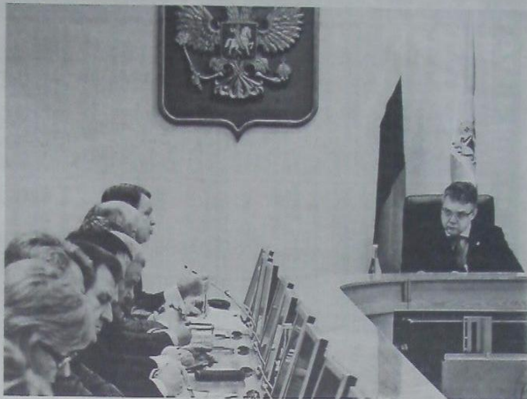
Управление по информационной политике аппарата Правительства Ставропольского края (по материалам пресс-службы губернатора и органов исполнительной власти СК)