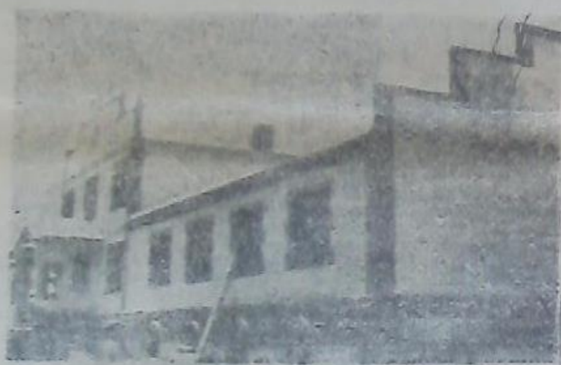
Пивзавод в Новопавловске.