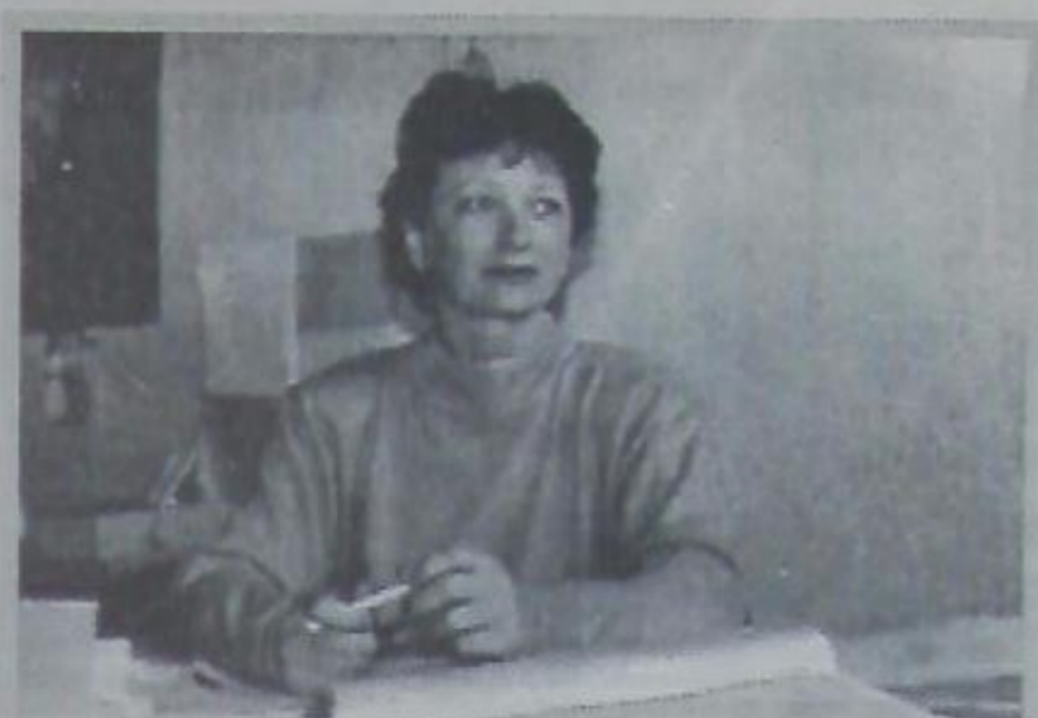
Митром - именно так называли в старину сборщиков налогов. Эти люди и сегодня не знают покоя и отдыха, добывая российской казне доходы. В первом квартале сего года в местный бюджет поступило 4638 тысяч рублей, в федеральный - 4673.

Кроме того, поправкой в закон-95 вводится норма, согласно которой избиратель по открытому избирательному округу может голосовать лишь в том