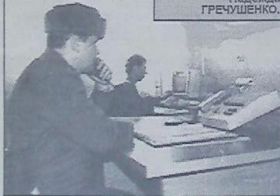
Рота ДПС спецполка «Южный» отметила свое новоселье - переселилась в отремонтированное здание бывшей ПМК - 2. На первом этаже разместились дежурная часть (на снимке), на втором этаже расположились служебные кабинеты. Помещения оборудованы техническими средствами связи, сотрудникам милиции созданы условия для работы.