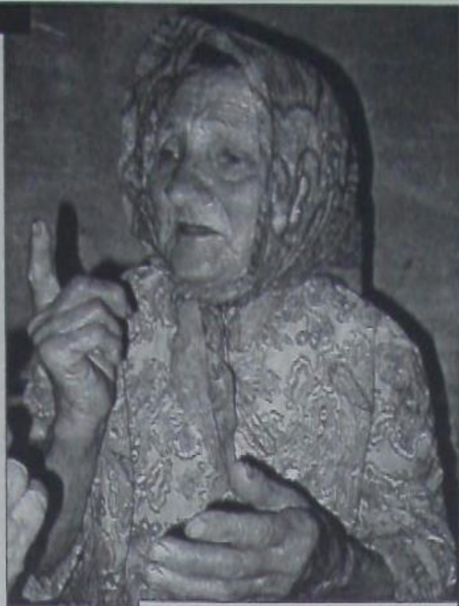
Теперь молюсь Богу за него...

Кати на улице Подгорной закипела работа. Помимо новой стены, строители установили в доме печь (старая сильно пострадала во время наводнения), все побелили и покрасили. Хата стала выглядеть лучше, чем до наводнения, а сердце... наконец-то отпустило. Утраченная была вера в людей - снова вернулась.