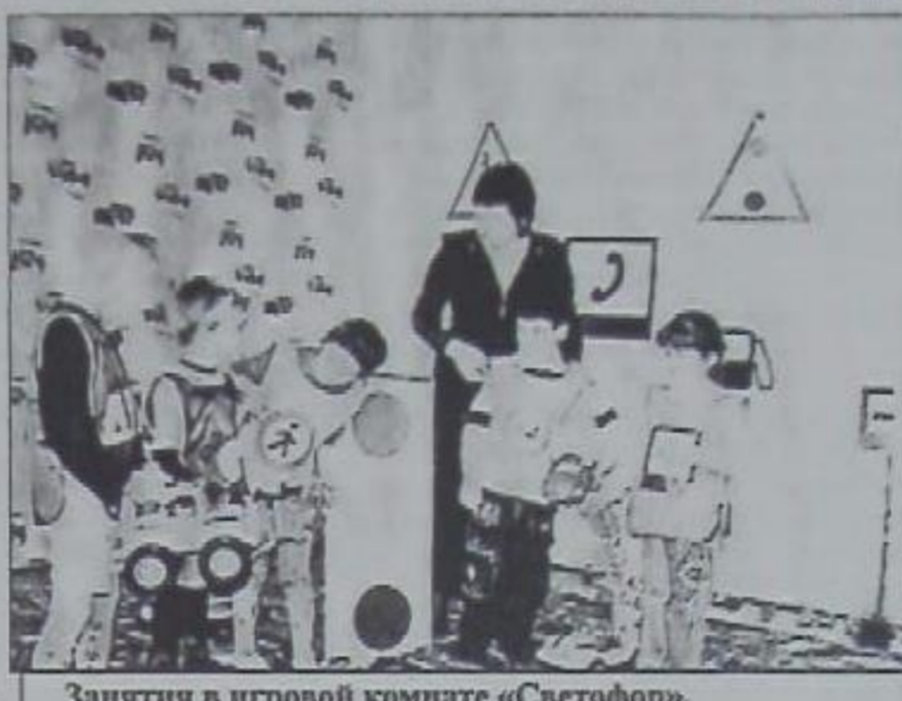
Занятия в игровой комнате «Светофор».