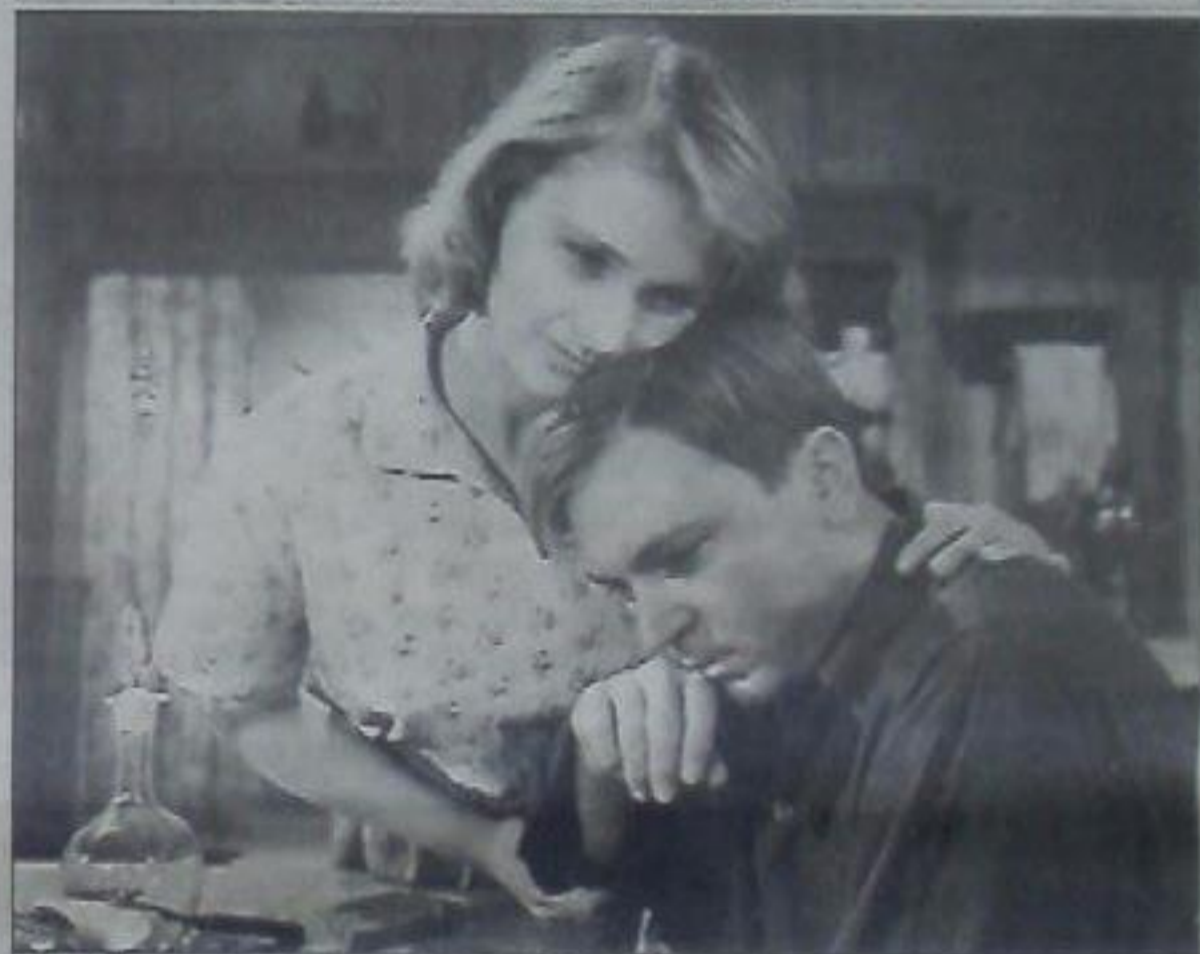
♦А этот кадр из известного фильма наверняка узнают все читатели.