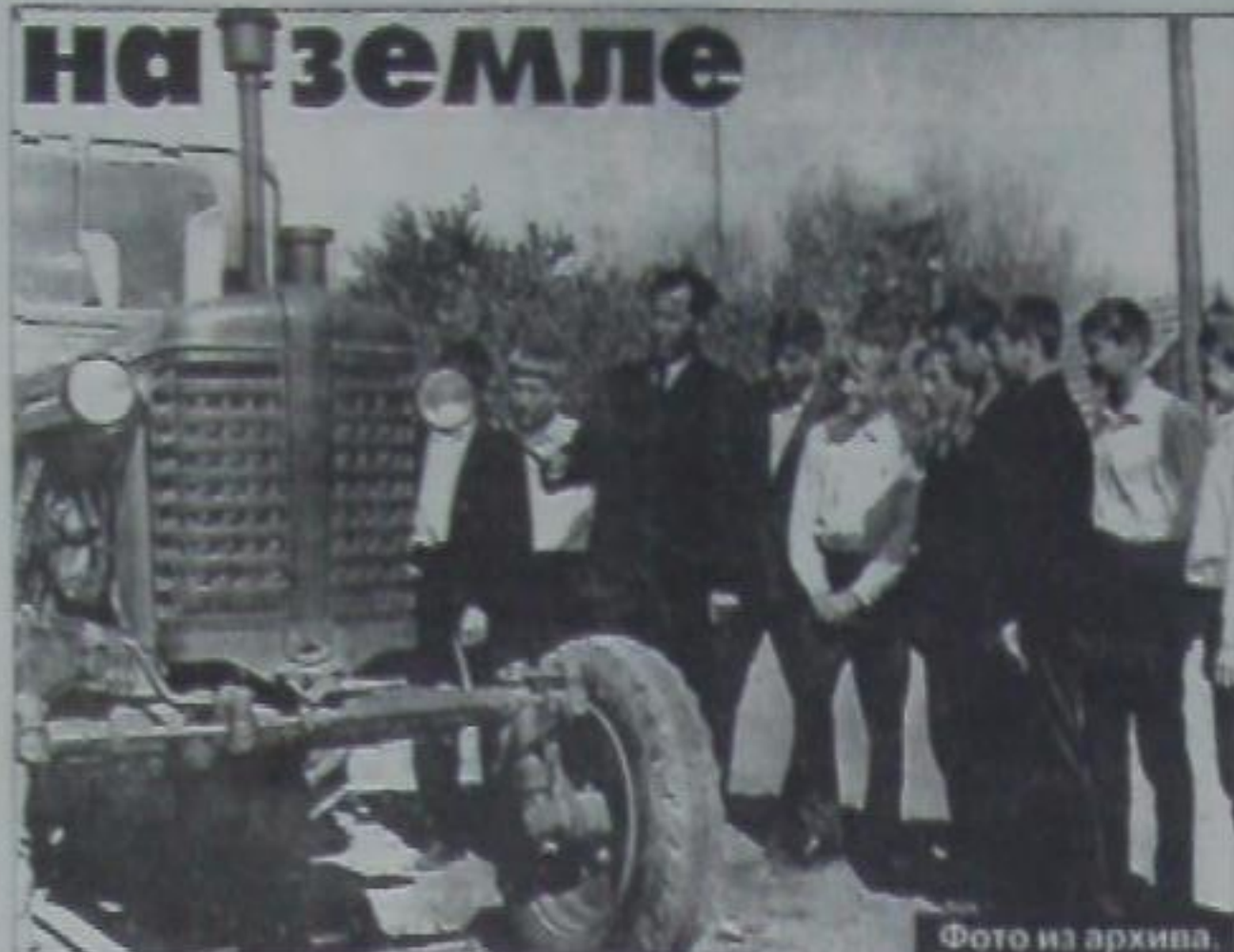
Фото из архива