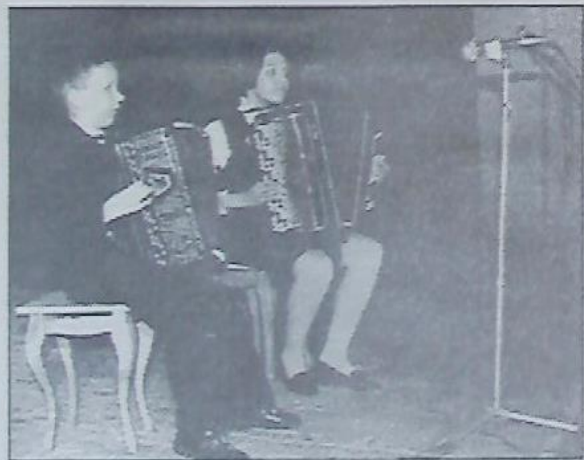
Играй гармонь, любимая...

16.00 - Фестиваль молодежной эстрадной песни с участием эстрадных групп Кировского района "Звездный дождь" на площади им. Ленина.