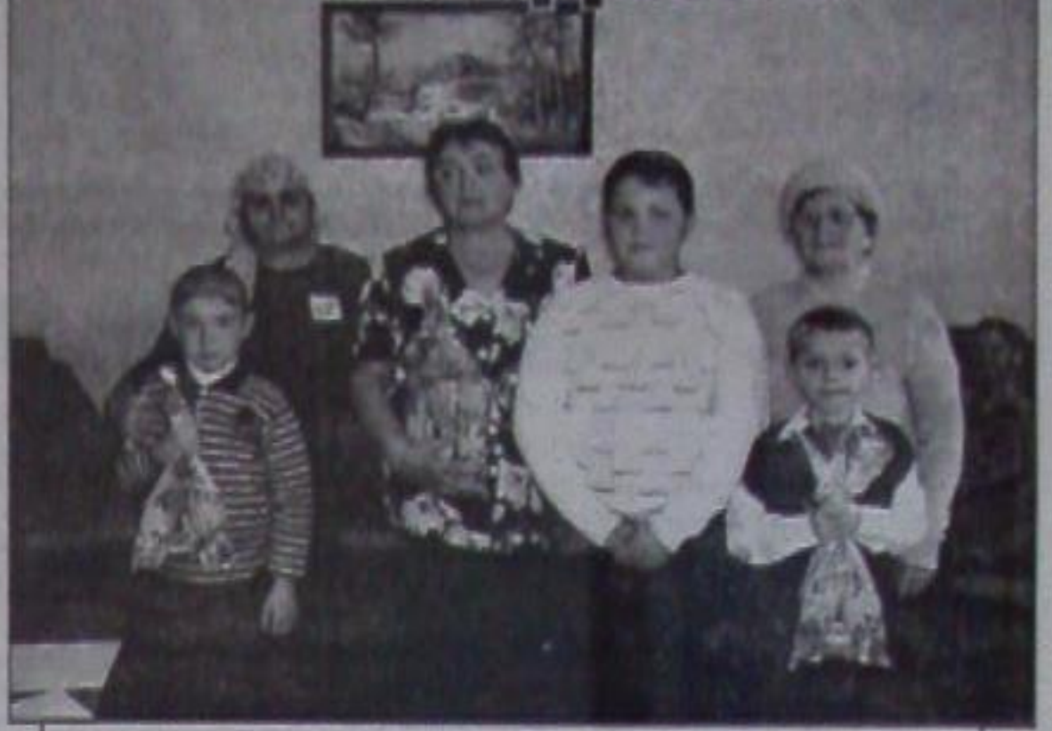
Бабушки конкурса со своими внуками.

ние у всех совпало: чтобы бабушка жила долго-долго!