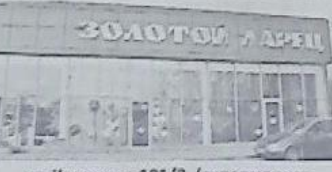
ул. Калинина, 101/2, (гипермаркет Магнит) с 10-00 до 19-00

9-10 МАРТА 2013 г. в г. Новопавловске, в ДК им. С.М. Романько, с 9.00 до 18.00