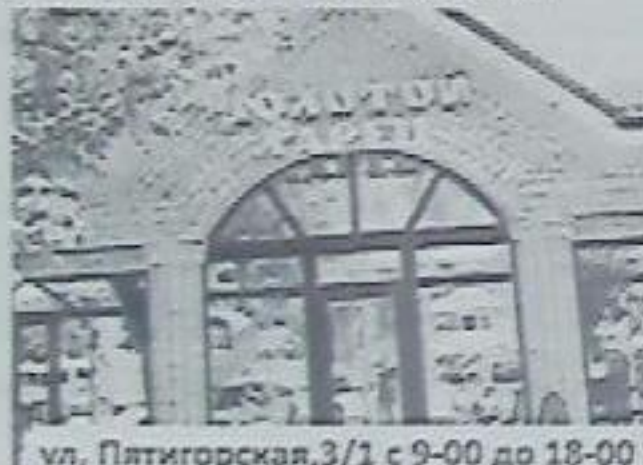
ул. Пятигорская, 3/1 с 9-00 до 18-00

ИП Черепнина И.В., ИНН 261901199683; ЕГРИП 310264129300030