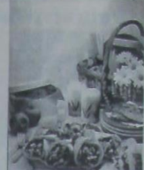
шала вымоченная и очищенная сельдь, 1 вареная свекла, 4 ложки салата, 2 яйца

Для крема: 400 г сливочного масла, 400 г сгущенного молока, 2-4 ч. л. какао (по желанию). Тщательно стереть размягченное (но не растаявшее) сливочное масло со сгущенным молоком. По желанию добавить в крем какао. На большое плоское блюдо уложить один слой безе, осторожно смазать их кремом, по вкусу пересыпать измельченными ядрами грецких орехов или миндаля. Таким образом укладывать слоями все приготовленное безе. Верхний слой безе обсыпать орехами и залить растопленным горячим шоколадом (около 200 г), добавив в него при растап-