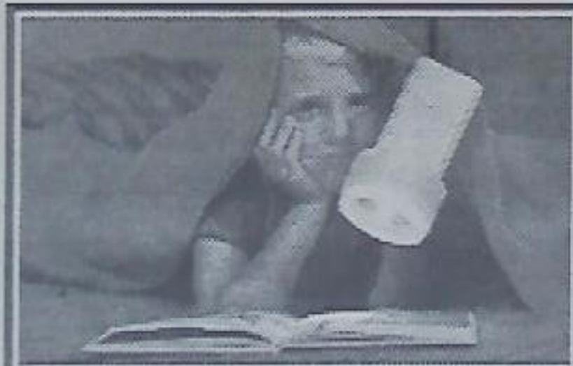
Не за горами зима, а из-за утечки в системе отопления в здании Комсомольского ДК постоянно холодно.