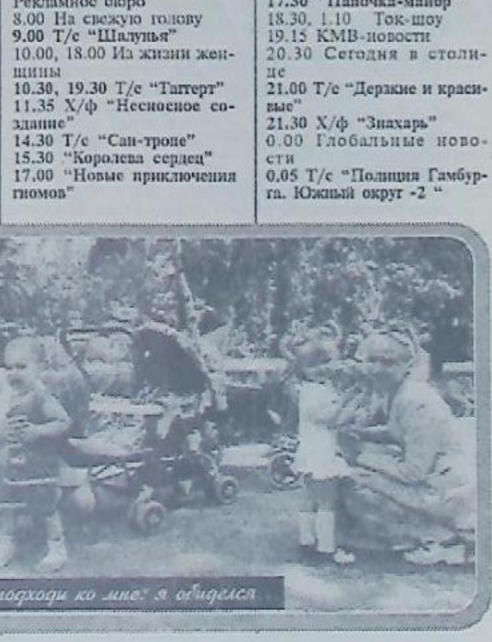
Не подходите ко мне, я обиделся

Рекламное бюро 8.00 На свежую голову 9.00 Т/с "Шалуныя" 10.00, 18.00 Из жизни женщины 10.30, 19.30 Т/с "Таттерт" 11.35 Х/ф "Несносное создание" 14.30 Т/с "Сан-тропе" 15.30 "Королева сердец" 17.00 "Новые приключения гномов" 17.30 "Папочка-майор" 18.30, 1.10 Ток-шоу 19.15 КМВ-новости 20.30 Сегодня в столице 21.00 Т/с "Держкие и красивые" 21.30 Х/ф "Знахарь" 0.00 Глобальные новости 0.05 Т/с "Полиция Гамбург. Южный округ -2"