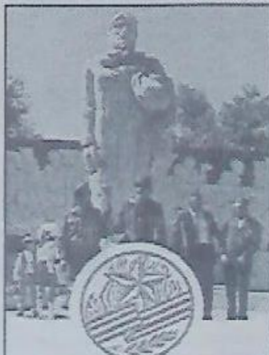
Мемориал Славы в Коммаеке, построенный в год 40-летия Победы советского народа в Великой Отечественной войне.