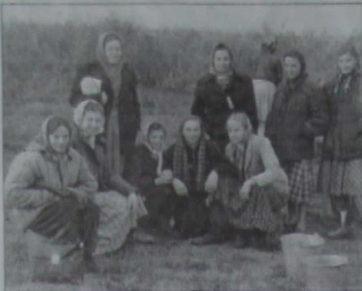
Комсомольцы помогают родному колхозу.