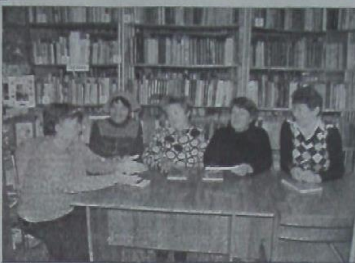
Спросите тех, кому за тридцать, — все были комсомольцами и вспоминают об этом с удовольствием. Почему? Да просто это была юность — самая светлая пора в жизни каждого.