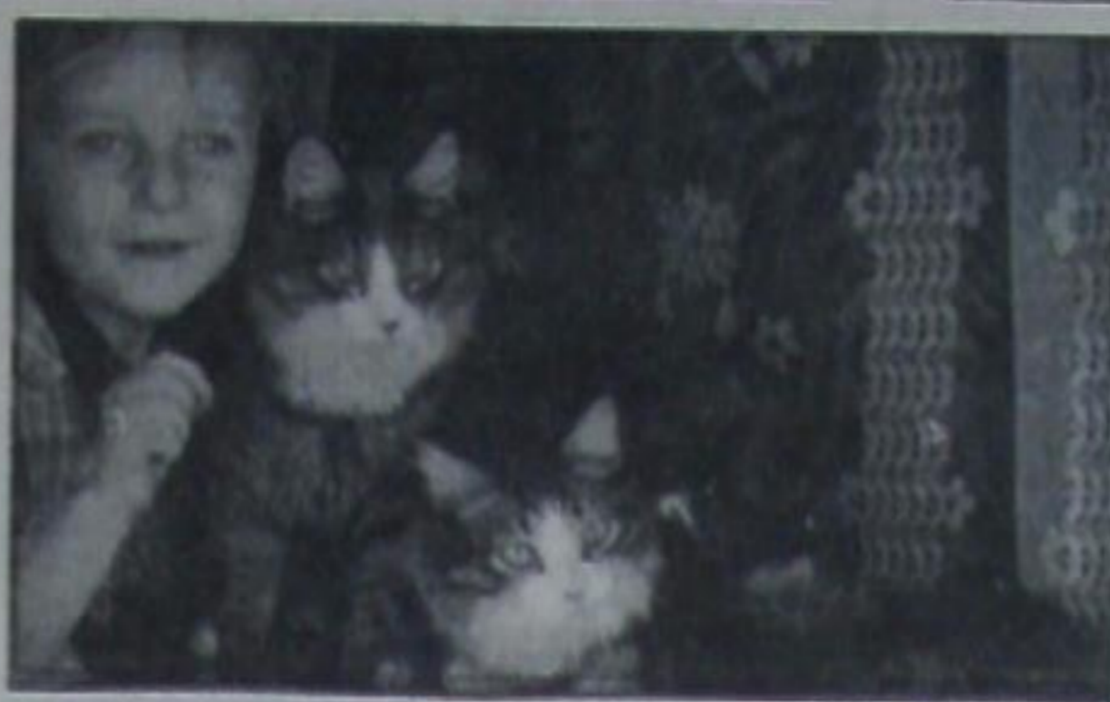
Как прекрасен этот мир...