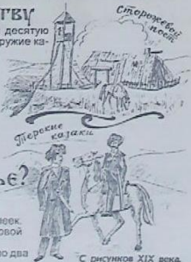
С рисунков XIX века.