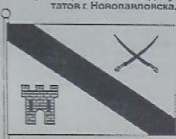
Герб и флаг Новоавловска. Автор рисунков - И.Д. ПРОСТИТОВ.