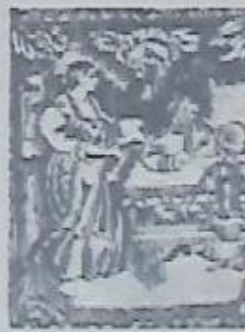
Не красна изба углами, красна пирогами