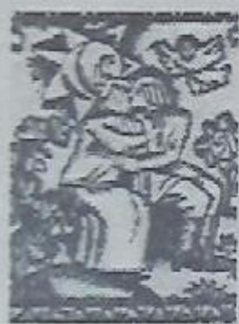
Всякая невеста для своего жениха родится