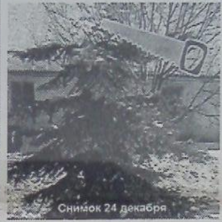
Снимок 24 декабря

И стоят у нас теперь перед глазами безголовые изуродованные ели-инвалиды, как немой укор живой природы человеку: вот оно, творенье рук твоих,