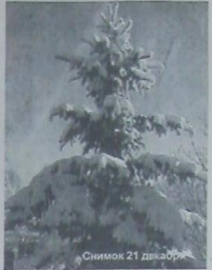
Снимок 21 декабря