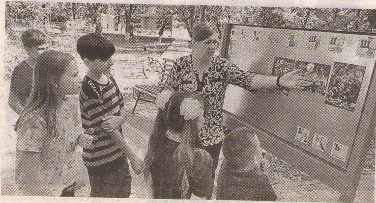
► Село Орловка.

«Голос времени» 16.09.2023 г. №(8459) 2,3