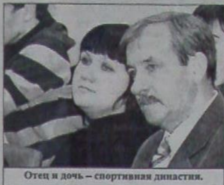
Отец и дочь — спортивная династия.

Отметили и глав. Благодарственные письма за подписью президента футбольной федерации края награждены главы