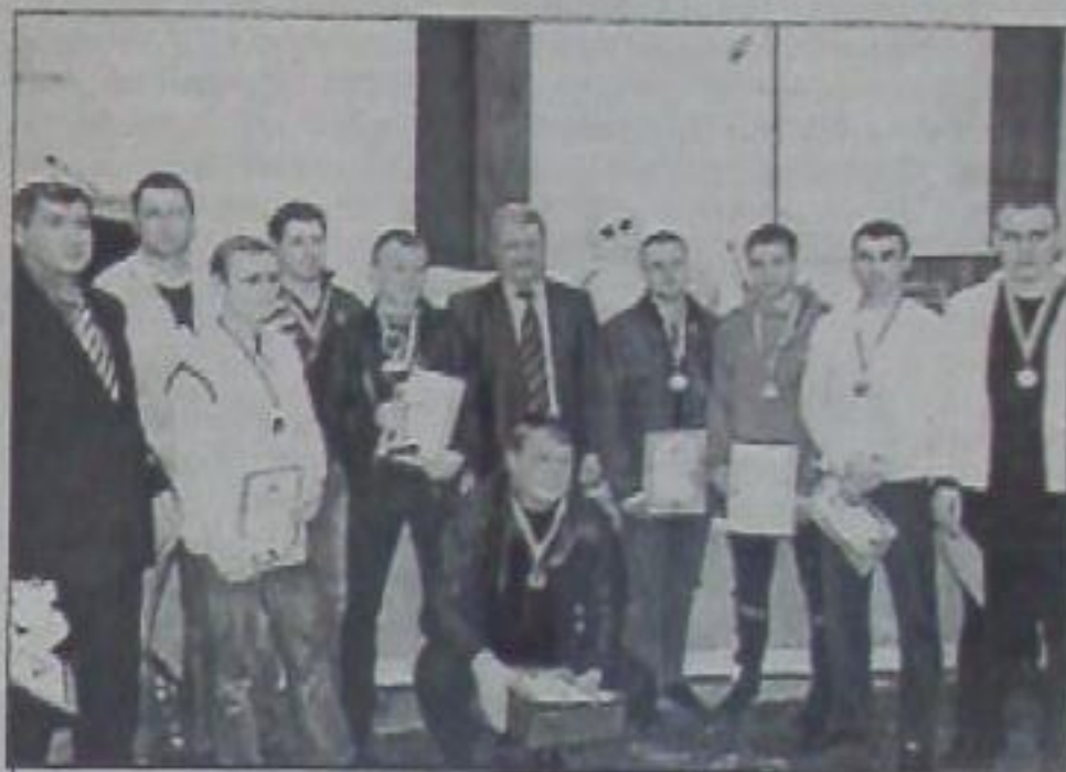
Сборная района по футболу, бронзовый призёр краевых соревнований.

ветеранов, тех, кто отдавал и продолжает отдавать воспитанию юных спортсменов время и силы, кто вкладывает в это душу и не мыслит иной жизни. Это