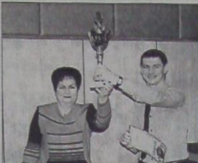
Главный редактор «Голоса времени» вручает кубок представителю команды «Факел» — победительнице районного первенства по футболу.