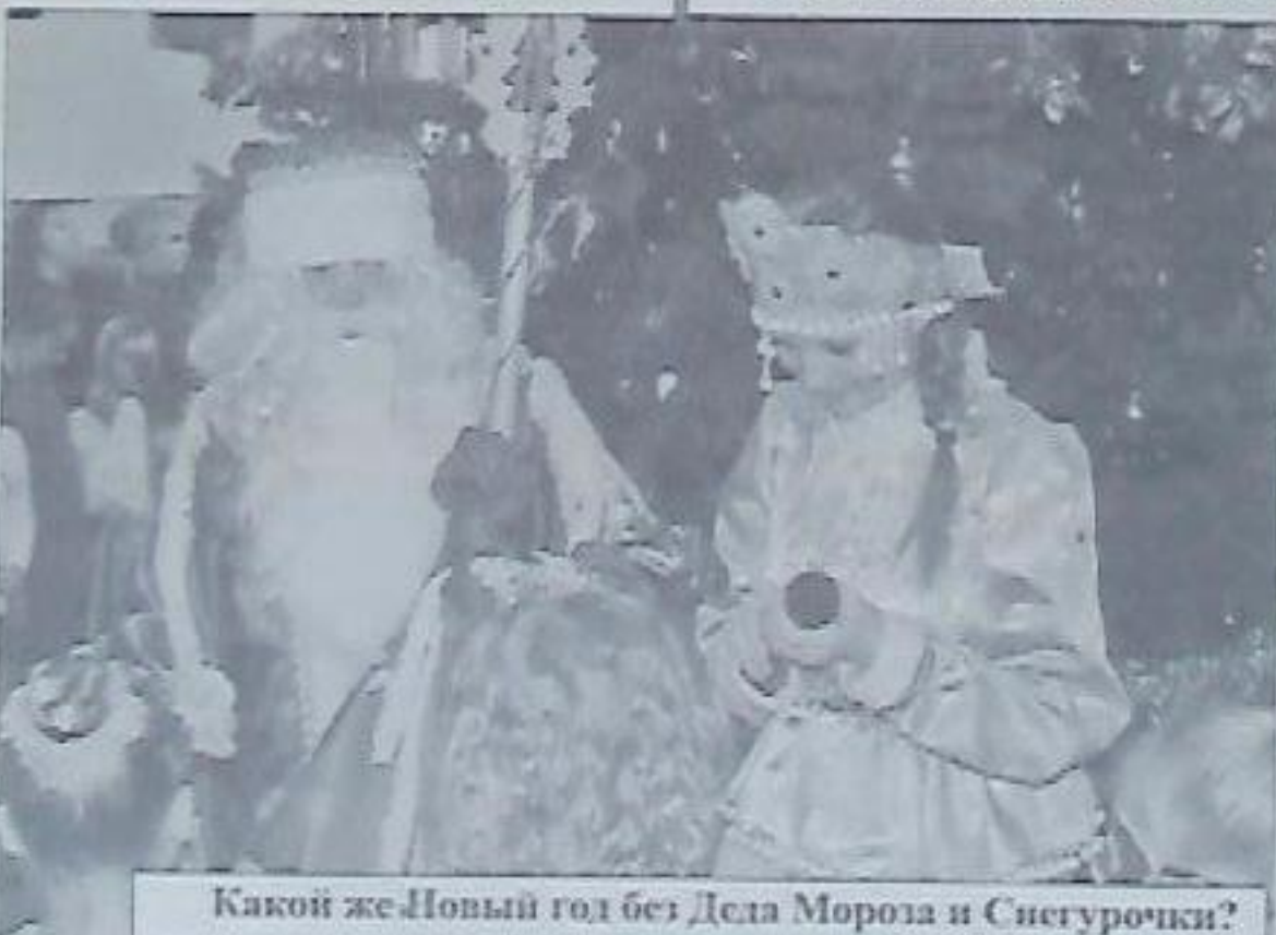
Какой же Новый год без Деда Мороза и Снегурочки?

фильмы. Прямо перед сеансом шли новогодние весёлые игры. Пятого же января состоялась премьера сказки Андерсена «Снежная королева» в исполнении юных артистов.