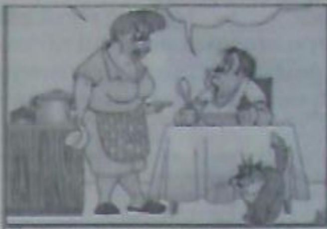
- Ну что, зятек, обед понравился? - Мамаша! Опять ищете повод для скандала?!

Теща приходит в гости. А сынок спрашивает: «Папа, а как я появился?» - «Тебя принес аист». - «А ты?» - «Меня принес аист». - «А мама?» - «Её принес аист». - «А