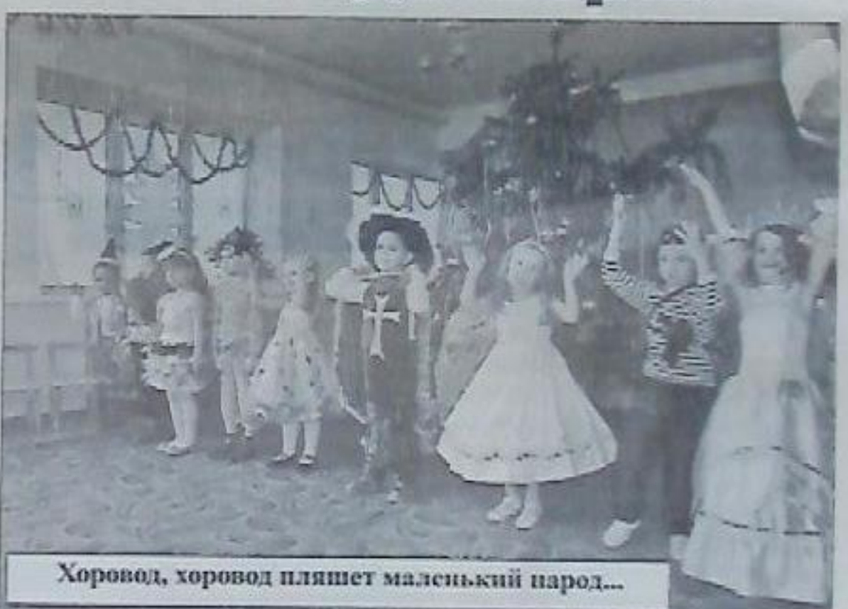
Хоровод, хоровод пляшет маленький народ...

А на зимних каникулах маленьких жителей города ждали мультипликационные и художественные