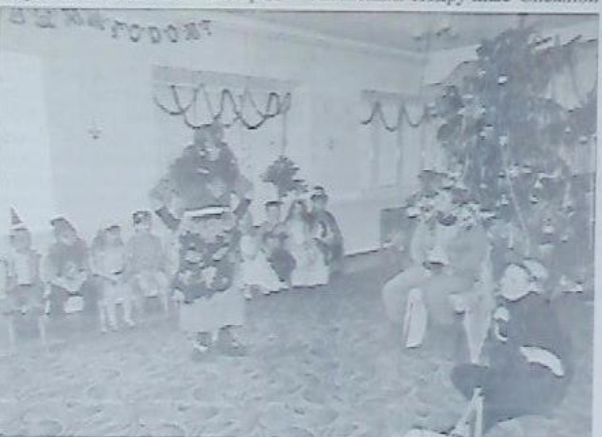
А в детском саду «Радуга» бабка Ёжка хотела испортить праздник. Но не тут-то было. Ребятишки и все сказочные герои прогнали ее с утренника...

В Новопавлоске новогодние утренники стартовали 25 декабря. А 29-го юных горожан встречала главная хвойная город-