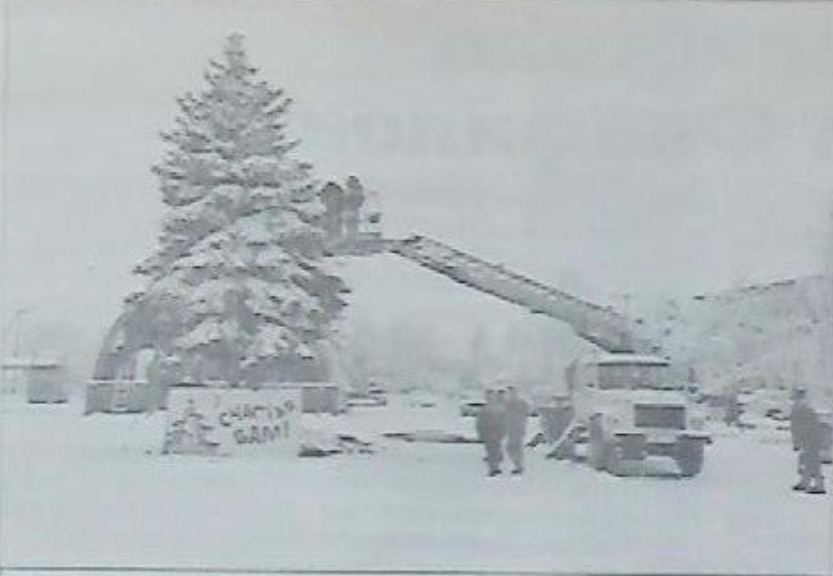
И вот она, ёлка-красавица, ждет городскую детвору

В Новопавлоске новогодние утренники стартовали 25 декабря. А 29-го юных горожан встречала главная хвойная город-