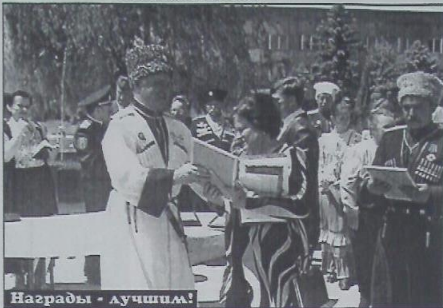
Награды - лучшим!

Четвертый краевой молодежный конкурс "Казачьему роду нет переводу" проходил в мае прошлого года. На нем состязались 14 команд со всего края. Итоги конкурса: первое место заняла кадетская школа Шпаковского района, второе - винсадская детская организация "Беркут" из Предгорного района, третьи оказались казачата Арзирского района.