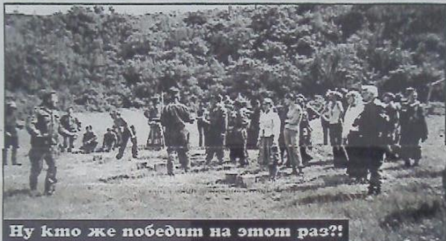
Ну кто же победит на этот раз?!