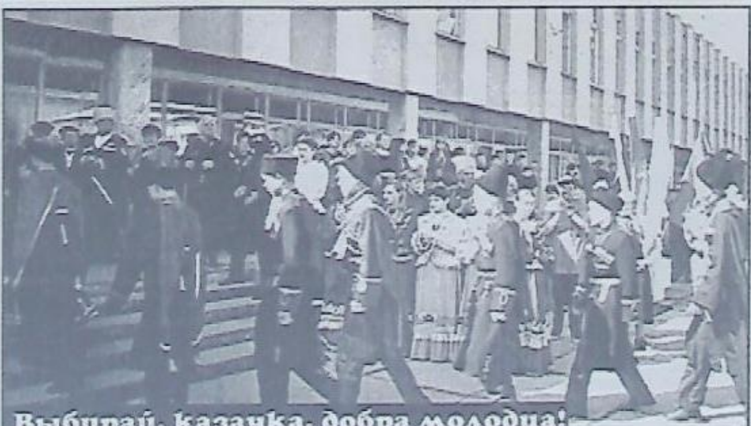
Выбирай, казачка, добра молодца!