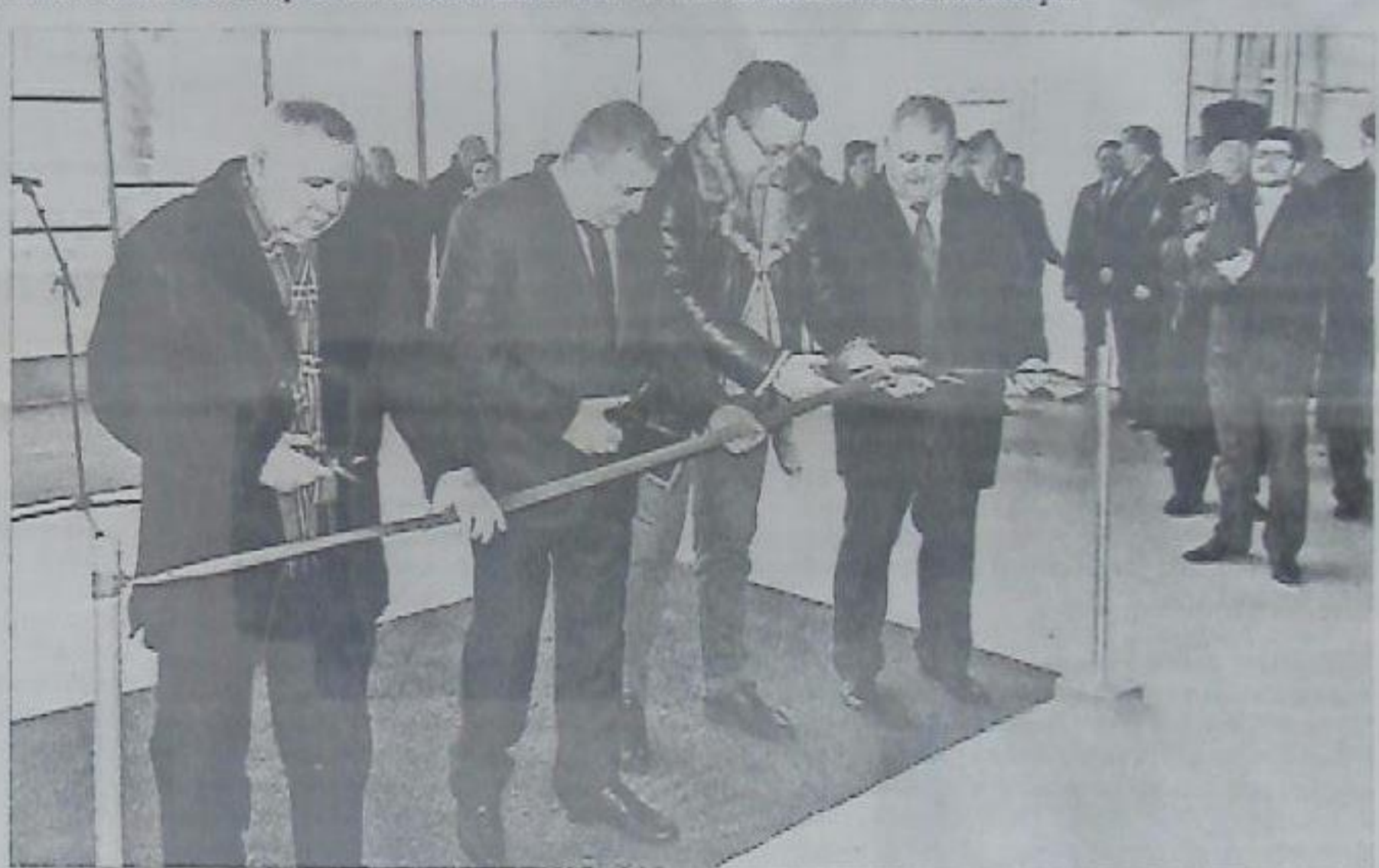
◆ Январь 2014 года. Открытие первой очереди тепличного комплекса — ООО «Овощи Ставрополья».

— Говорят, будут свои теплицы и в Новопавловске?