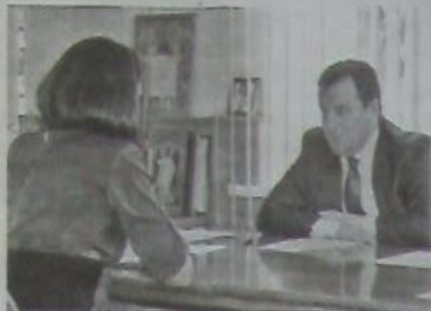
Интервью министра труда и социальной защиты населения Ставропольского края И.И. УЛЬЯНЧЕНКО

- Иван Иванович, на Ставрополье третий год реализуется подпрограмма «Доступная среда» государственной программы Ставропольского края «Социальная поддержка граждан». Что уже сделано для улучшения социального самочувствия инвалидов?