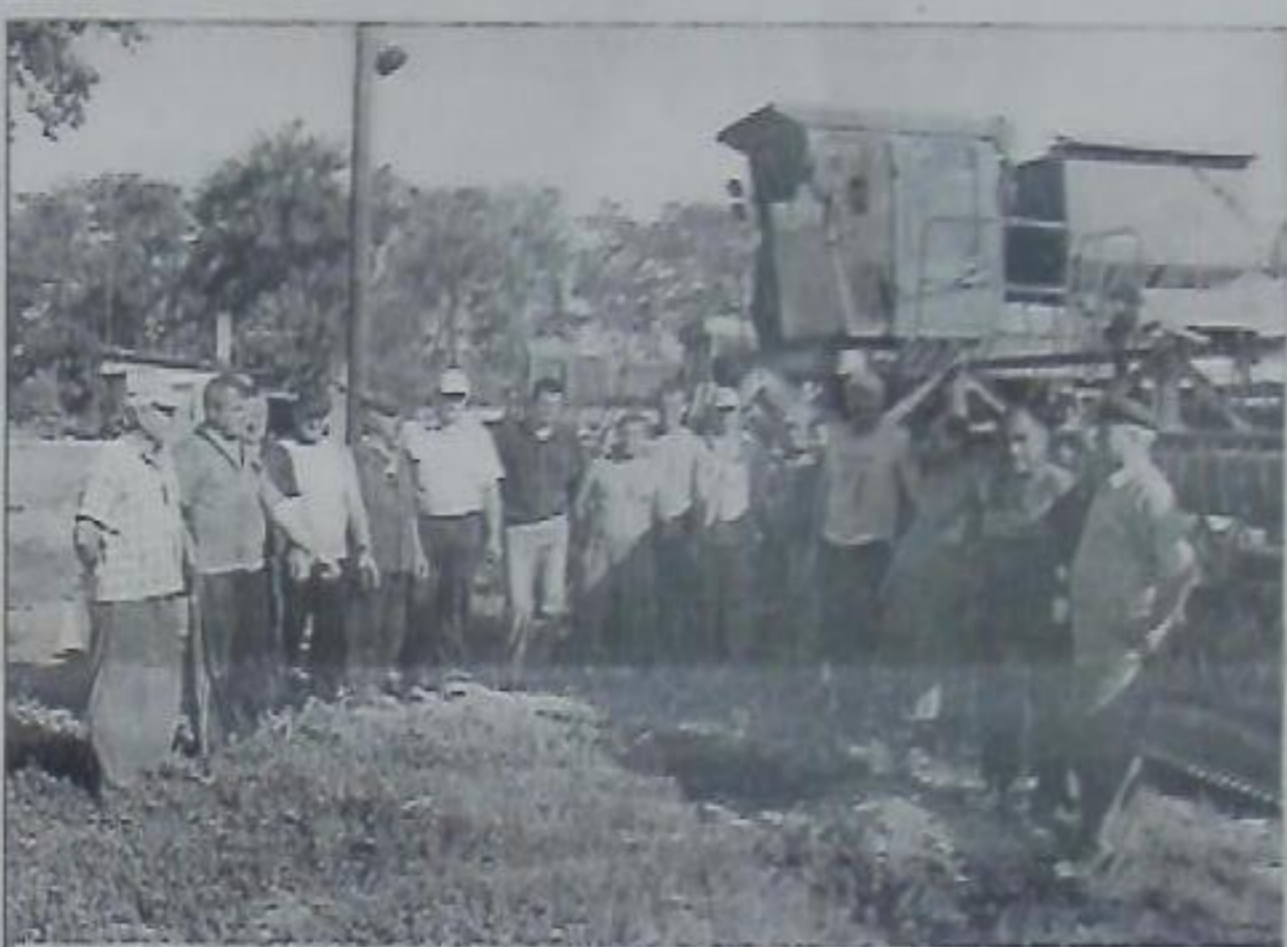
Уборочный комплекс колхоза «Орловский» почти в полном сборе.

Орловчане традиционно сеют лён. Спросом он пользуется, а стоит подороже пшеницы. Вообще ценовой вопрос сегодня самый болевой для крестьянина. «В прошлом году себестоимость пшеницы у нас сложилась три-три с половиной рубля за килограмм, ячменя – два