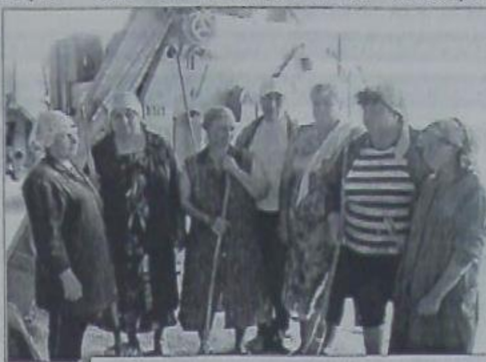
Ох и нелегкий труд у этих представительниц слабого пола!

— Нам давно сказали: живите сами, — соглашается председатель.