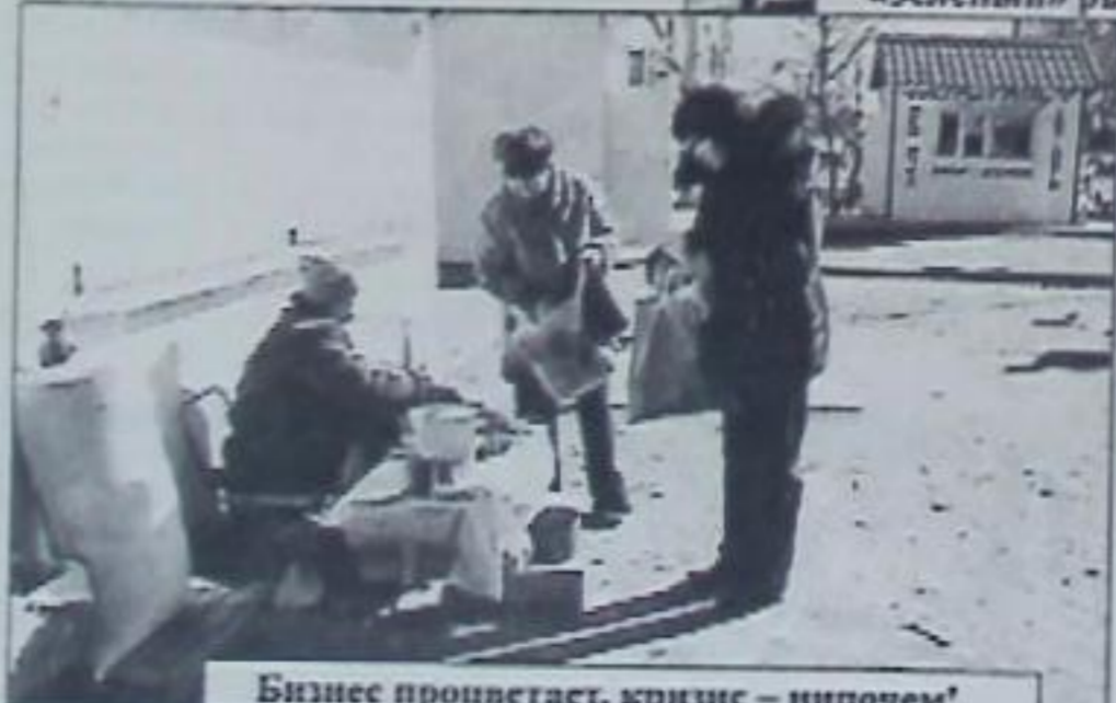
Бизнес процветает, кризис – ни о чем!

брю слова нашего президента Д.А. Медведева. Выступая недавно перед прессой, он заявил, что надо больше мест в вузах делать на бесплатной основе, потому что студенты должны получать образование, а не вузы зарабатывать на них деньги. И это, согласитесь, одна из главных составляющих экономического положения семей, где есть студенты, ведь оплата обучения забирает значительную часть семей-