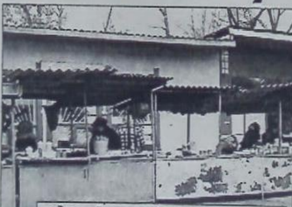
«Зеленый» рынок. Покупателей не густо...