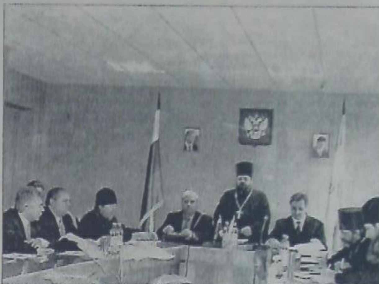
Перспективы сотрудничества Церкви с властью, государственными и общественными организациями обсуждались на Совете председателей миссионерских комиссий Ставропольской и Владикавказской епархии 16 декабря в городе Новопавловске.