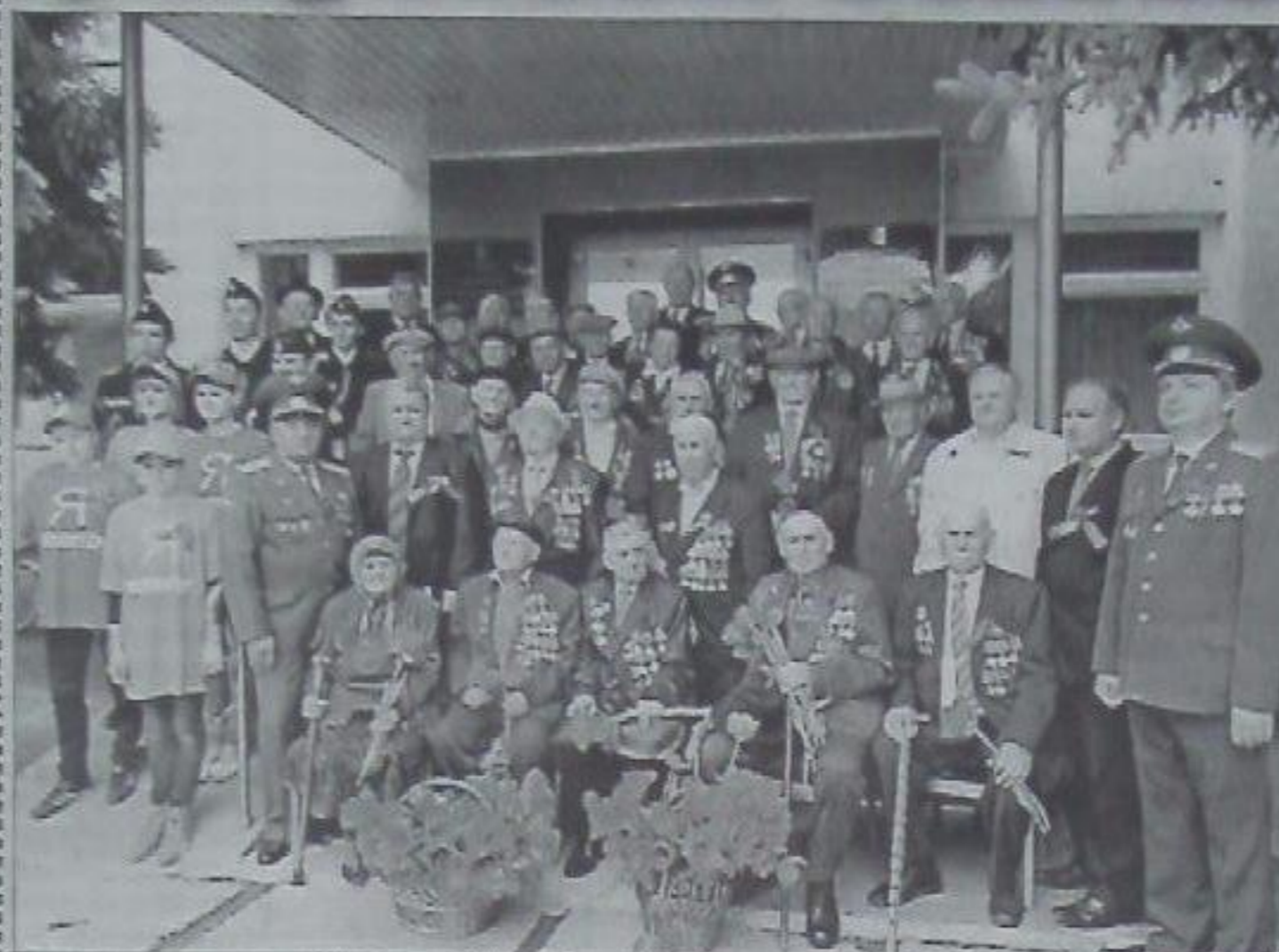
Фото на память. 7 мая 2011 года. Встреча в районной администрации.

В светлый и святой праздник 9 мая искренне желаю всем жителям края мирного неба, крепкого здоровья, любви близких и близких!