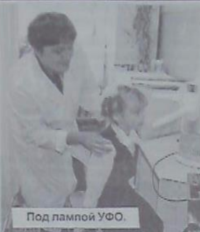
Под лампой УФО.

Средняя-то она средняя, но уже пять лет является краевой экспериментальной площадкой по внедрению здоровьесберегающих технологий. За это время «через эксперимент» прошли более ста учеников начальной школы, собраны 16 (!) папок с результатами работы. И эти результаты говорят сами за себя.