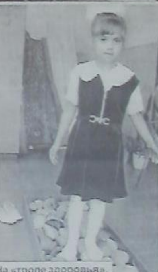
На «тропе здоровья».

В школе оборудованы два спортзала, большая спортивная площадка, есть тренажеры и теннисные столы. Работает