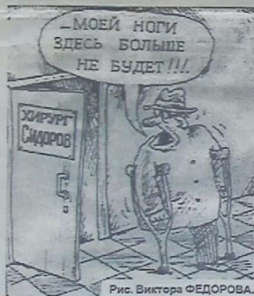
Рис. Виктора ФЕДОРОВА.

Так что же это все - таки было? Откуда ждать ответа на этот вопрос? Может лет через 20 мы узнаем правду об этом "цветном" дожде?