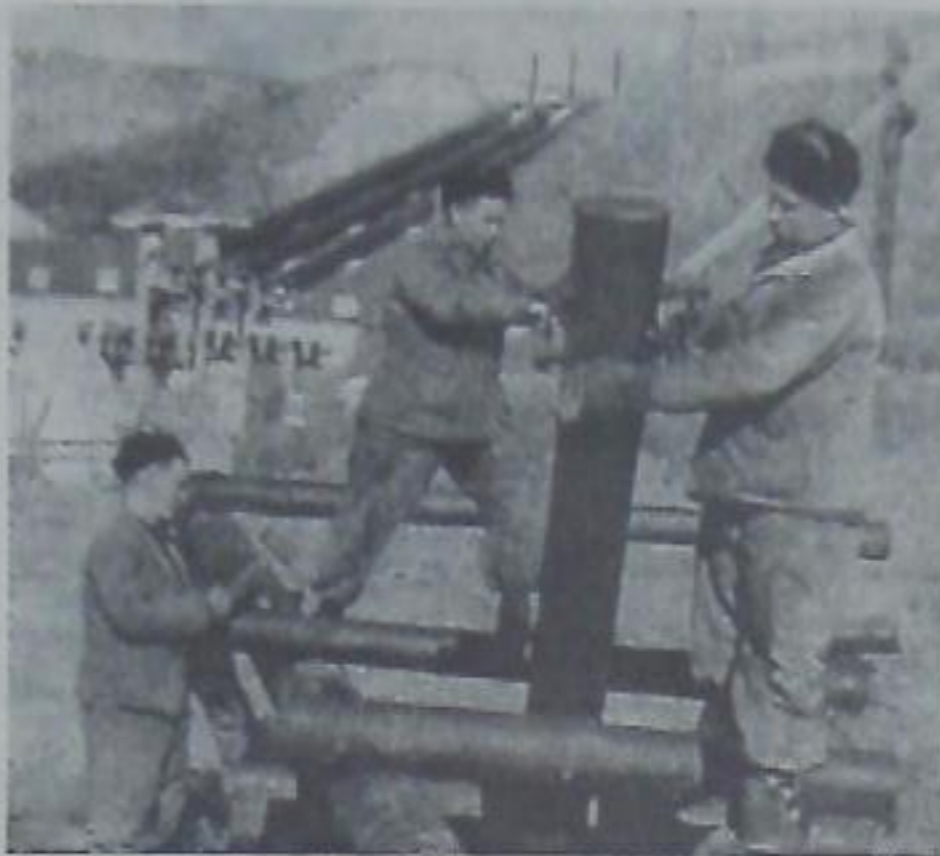
На снимках: установка первой линии электропередач; щит управления Орловской ГЭС.