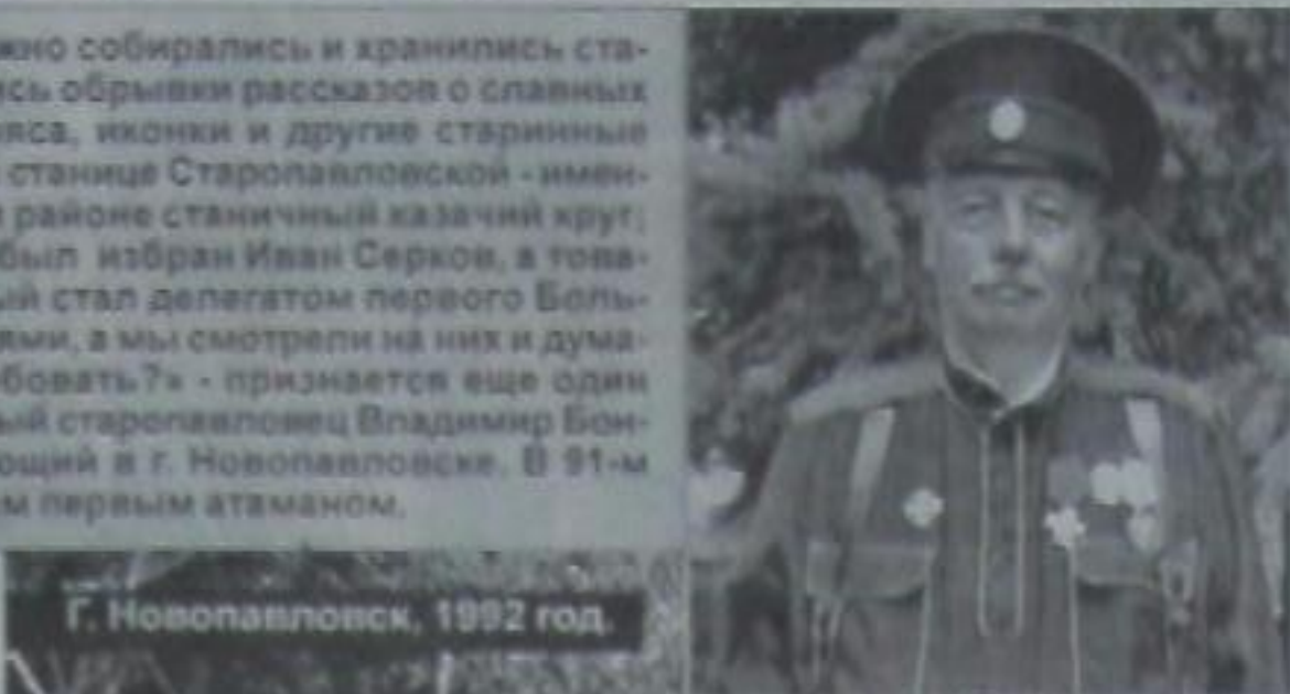
Г. Новопапавловск, 1992 год.