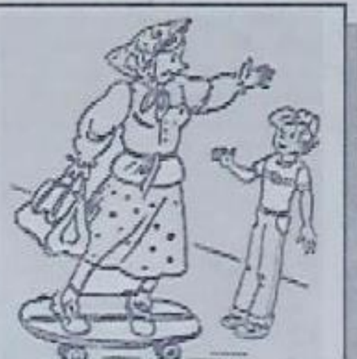
Я, внучек, только в булочную стаяю!

В России стекольные заводы появились во времена Петра I, и с тех пор зеркала стали широко использоваться в быту, архитектуре и технике - в прожекторах, телескопах, микроскопах.