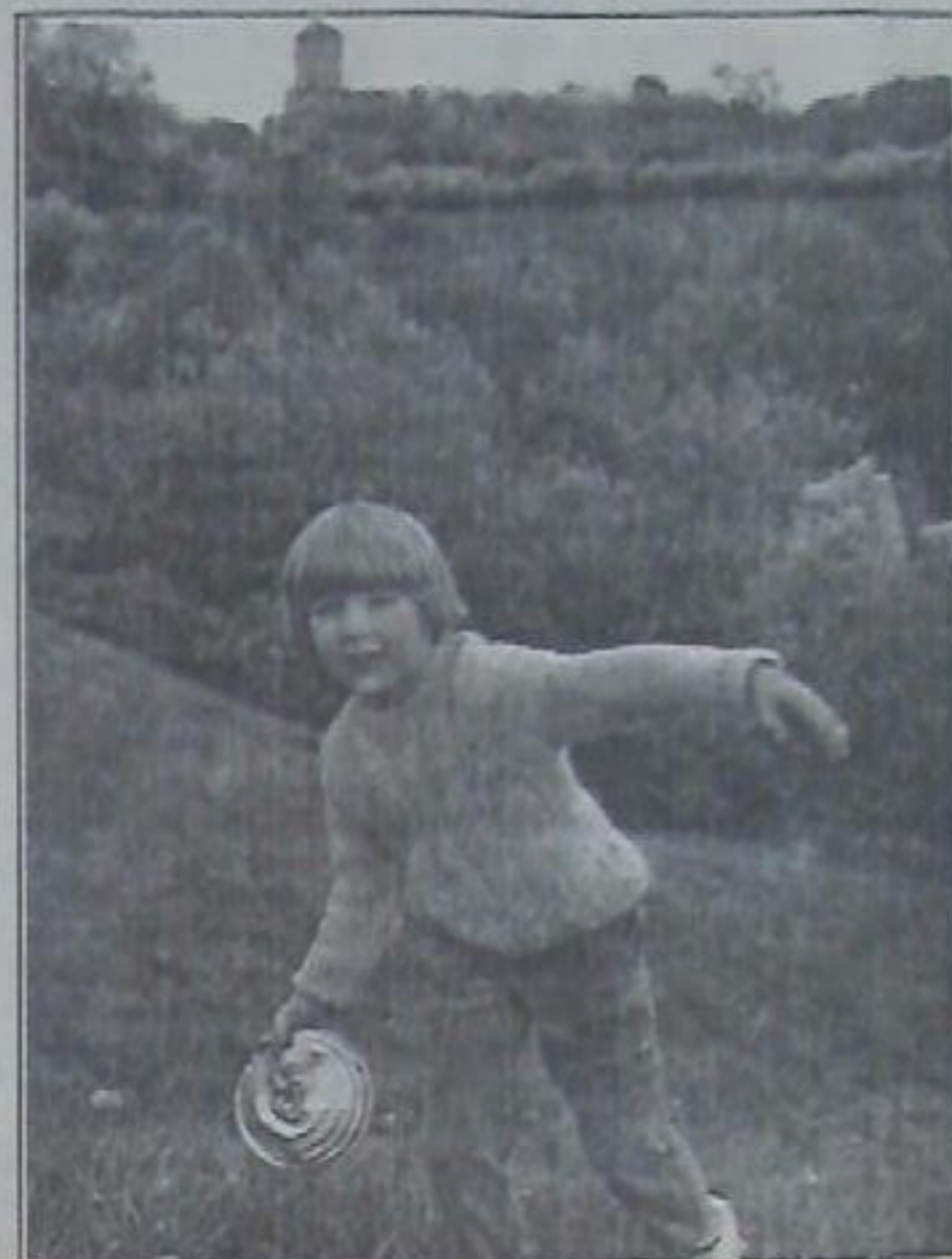
Последние солнечные дни...