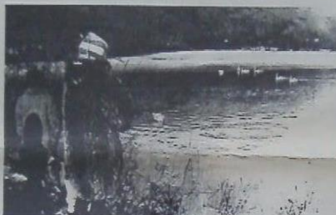
Весна... И птицы возвращаются.