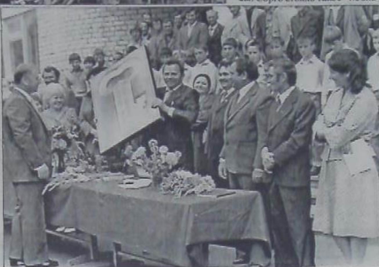
На открытии школы в селе Горнозаводском.

Стал отгадываться дальше, анализировать. Спасибо, у одного из