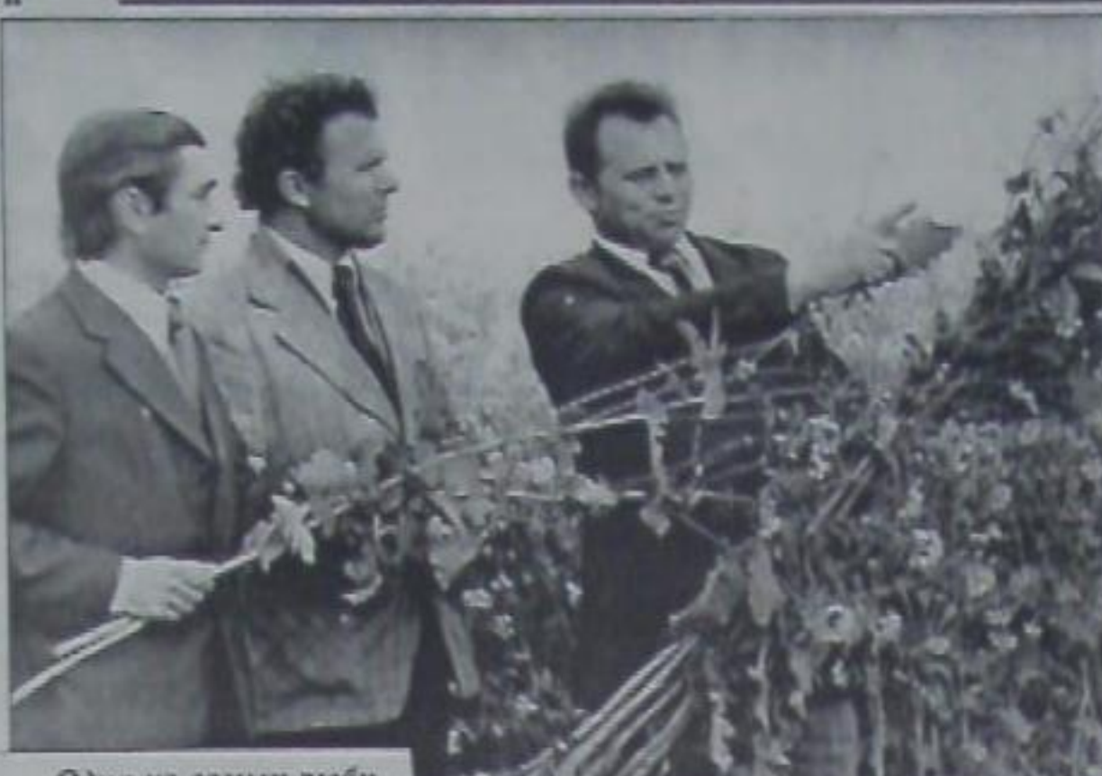
Одна из самых любимых культур юбиляра - рапс.

колхоза, имеющего 104 тысячи гектаров земли, квартиру и машину, - такие радужные перспективы предложили молодому специалисту сразу после распределения. Отказался, предпочел пойти под начало к опытному человеку. И такой человек был. Однако сперва в выбранном хозяйстве ждали сплошные испытания.