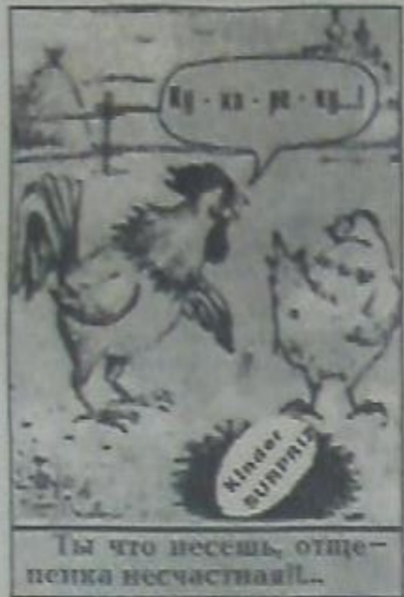
Ты что несешь, отцепка несчастная!..

Но все же я шлю искренние поздравления и пожелания счастья и удачи всем крестьянам района в Новом 1999 году! Богатых вам урожаев, тепла и радости в ваших домах!