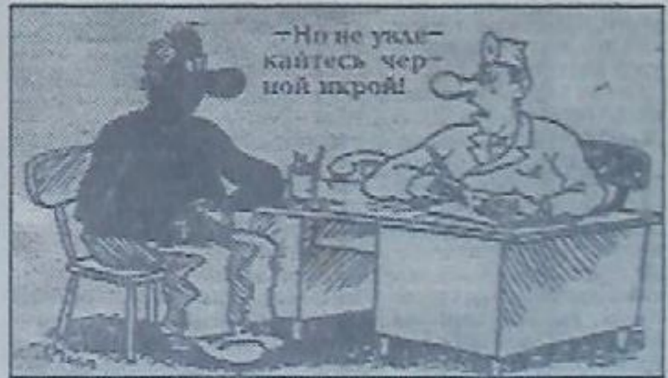
Но не укажите черной икрой!

Крепкого вам здоровья, кировчане, в Новом году!