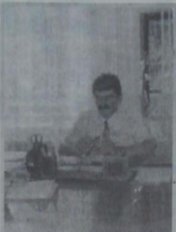
ре, в ЗАГСе. За полгода в брак вступили 90 человек, за регистрацию 4,5 тысячи рублей пошлины уже в наш бюд-

жет не поступили, а ведь эти доходы были раньше в него заложены.