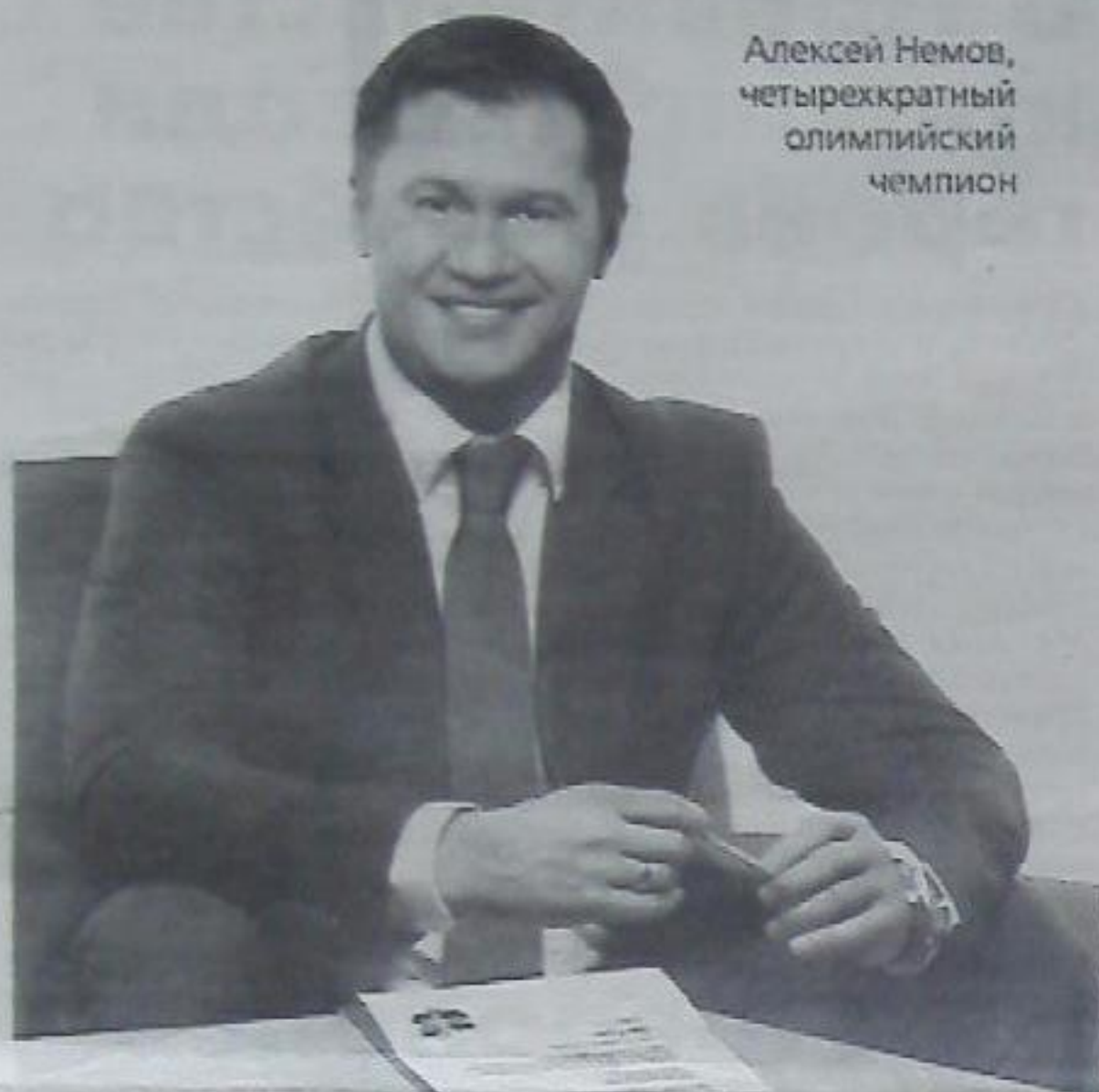
Алексей Немов, четырехкратный олимпийский чемпион