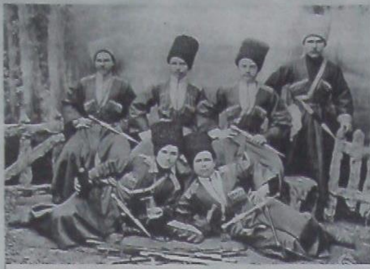
◆ Интересны фотографии новопавлоских казаков периода 1914-1916 годов

Со временем казаки обустроились, распахали и засеяли землю. С каждым годом станица разрасталась, сюда прибывали переселенцы и беглые крестьяне из центральных губерний. К середине XVIII века встал вопрос о переселении станицы. На старых местах возле крепости часть жителей осталась до 1864 года, когда, после завершения Кавказской войны, крепость Павловская была срыта как утратившая своё значение. Оставшиеся жители старой станицы Павловской перебрались частью в станицу Новопавлоскую, которая стала селиться на левом берегу реки Куре. Другая часть переселилась в станицу