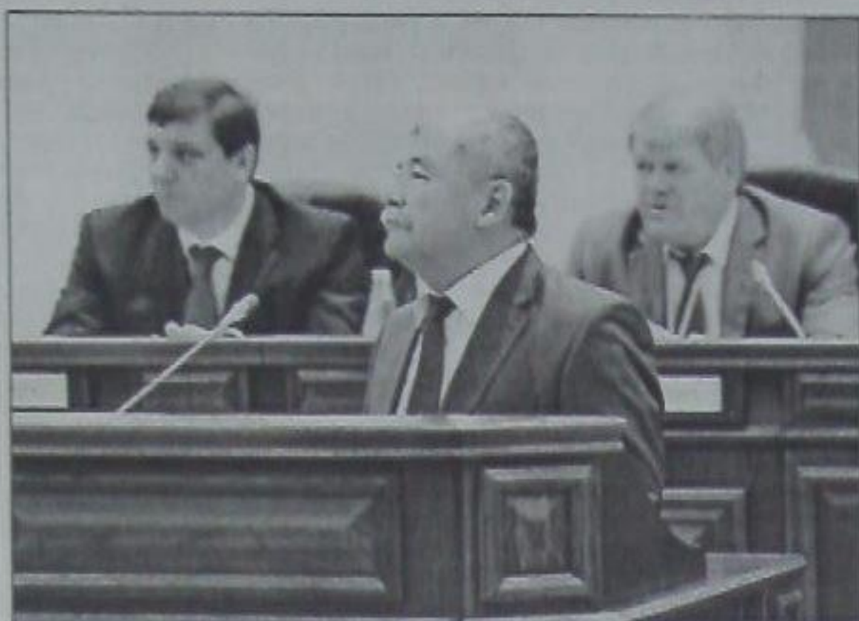
Главу региона поддержал вице-губернатор – председатель Правительства края Юрий Тыр-

Валерий Зеренков подчеркнул, что в крае разработано около 90% необходимого объема документации территориального планирования, из которого окончательно утверждено менее половины. Губернатор нацелил органы местного самоуправления, а также Правительство края на завершение необходимого ком-